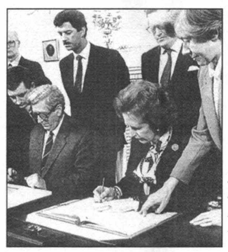
امضای موافقت نامه انگلیس و ایرلند در قلعه هیلزبورو در ۱۵ نوامبر سال ۱۹۸۵ با دکتر گارت فیتز جرالد