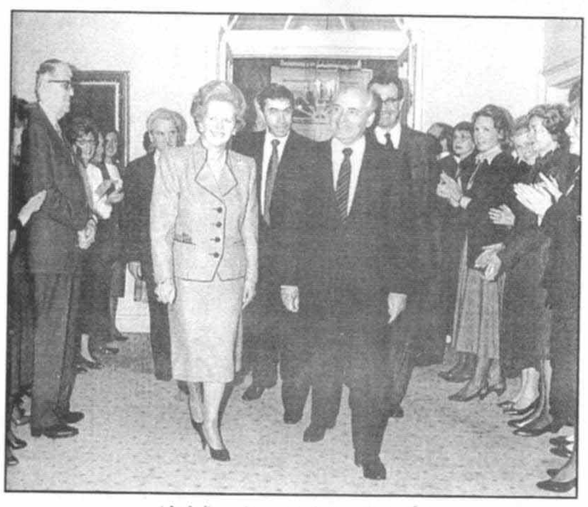
گورباچف در شماره ۱۰، سپتامبر سال ۱۹۸۹