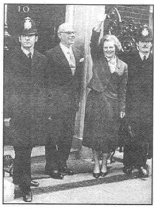
بادنیس بر روی پلههای شماره ۱۰ در چهارم مه سال ۱۹۷۹