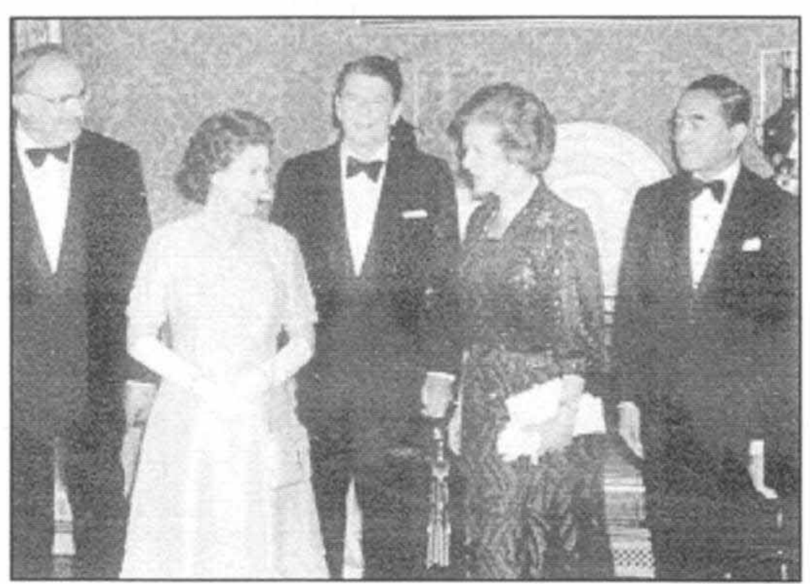
شر کت کنندگان در اجلاس سران گروه ۷ در لندن ، ژونن سال ۱۹۸۴ از چپ به راست : هلموت کهل، ملکه، رونالدریگان، خودم، یوشیرو ناکازونه