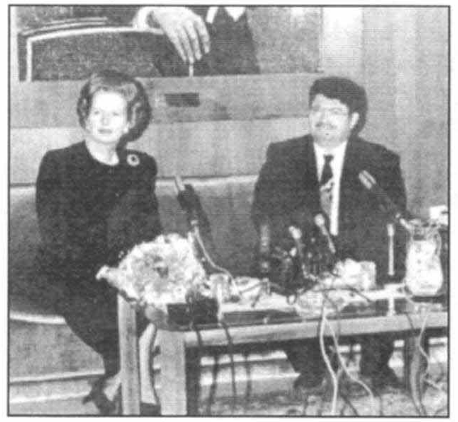
ملاقات باتورگوت اوزال، رئيس جمهوري تركيه، آوريل ١٩٨٨