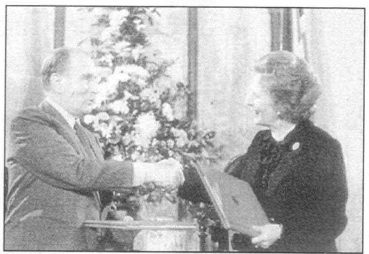
مبادله اسناد موافقت نامه تونل مانش با پرزیدنت میتران در کانتربری، فوریه سال ۱۹۸۶