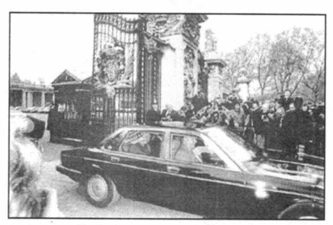
ترك كاخ باكينگهام پس از استعفا، ۲۸ نوامبر سال ۱۹۹۰