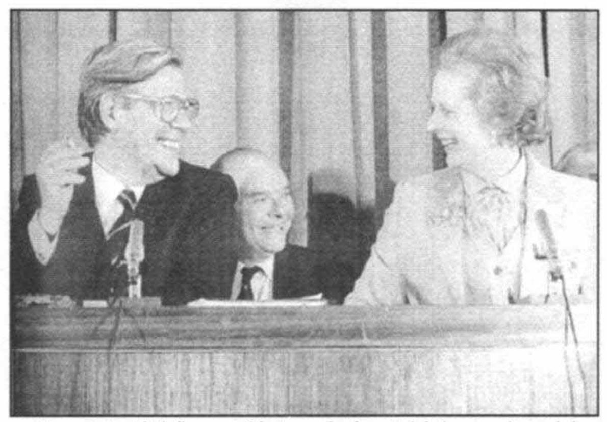
با هلموت اشمیت در یك كنفرانس مطبوعاتی پس از مذاكرات مه سال ۱۹۷۹، نخستین دیدار م با یك رهبر خارجی به عنوان نخست وزیر