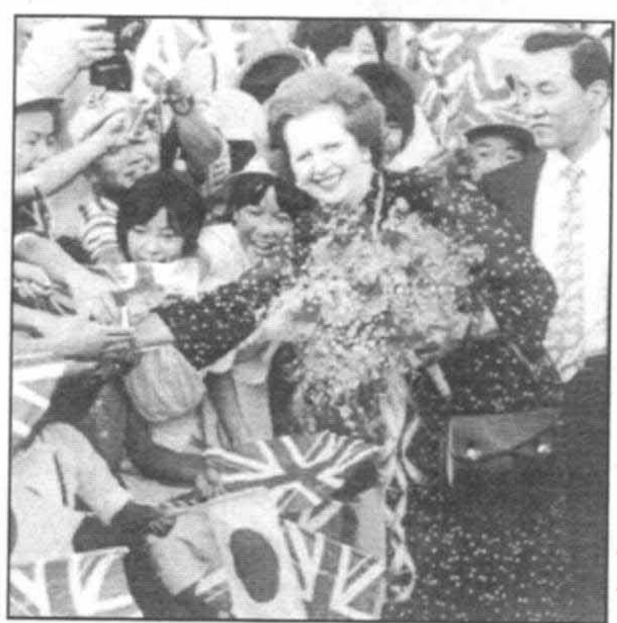
بـازدیـداز نسیـروگـاه در خـلال سـفـرم بـه ژاپن در سپتامبر سال ۱۹۸۲