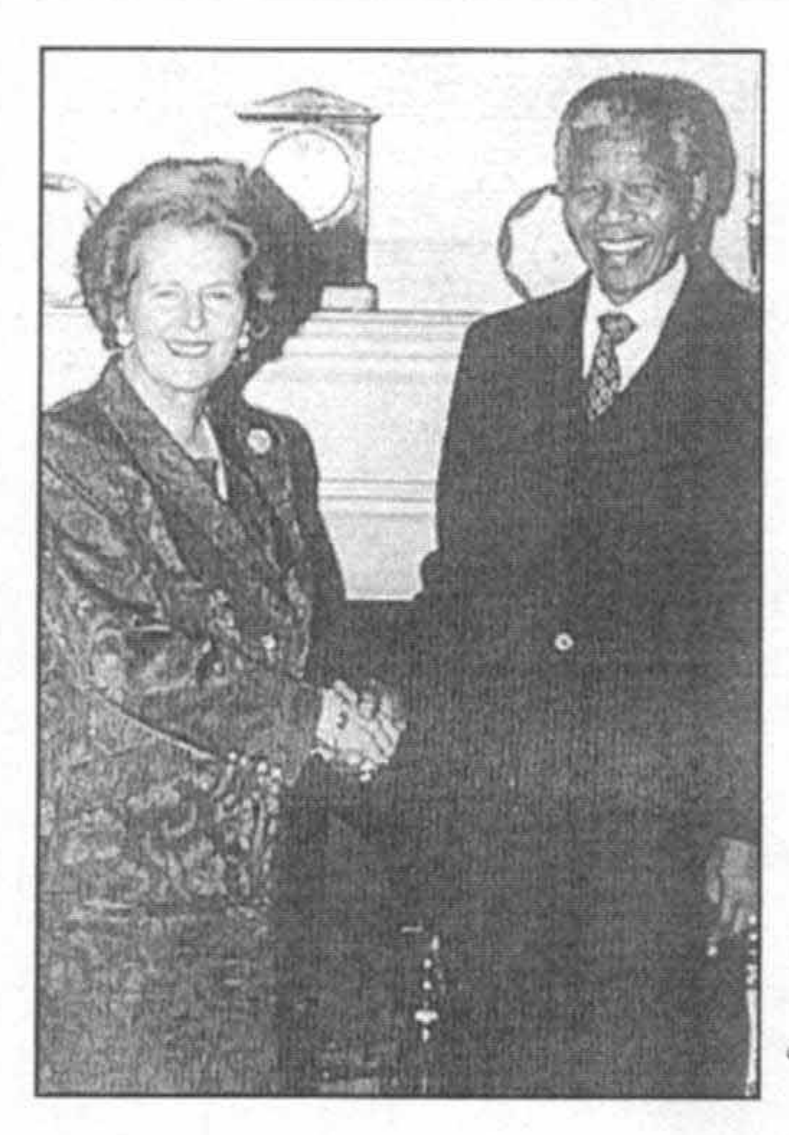
با نلسون ماندلا در خلال سفرش به لندن در ژوئیه سال ۱۹۹۰