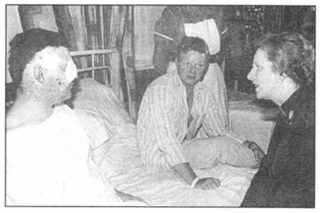
ديدار از زخمي ها در بيمارستان پس از انفجار بمب در ريجنت پارك در ژ