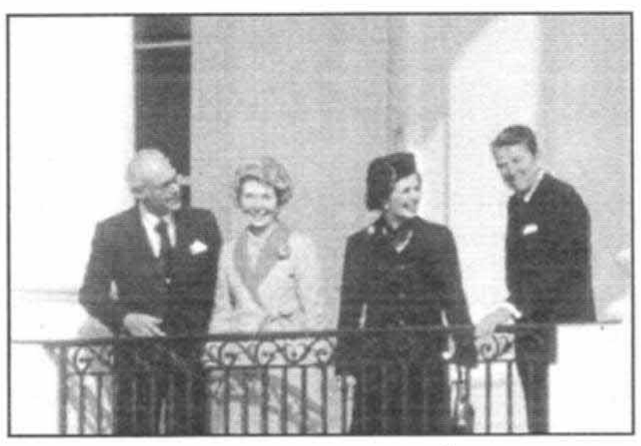
با دنیس و ریگان ها در ایوان کاخ سفید، ژونیه سال ۱۹۸۷