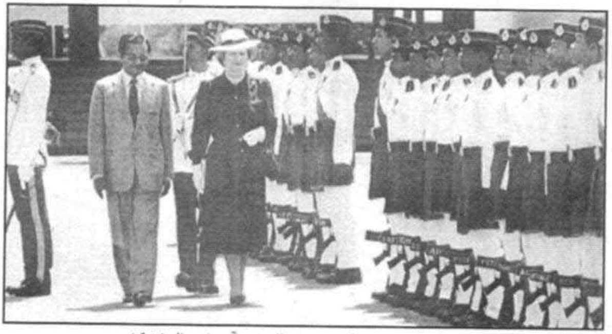
سان از نیروها در خلال سفرم به مالزی در آوریل سال ۱۹۸۵