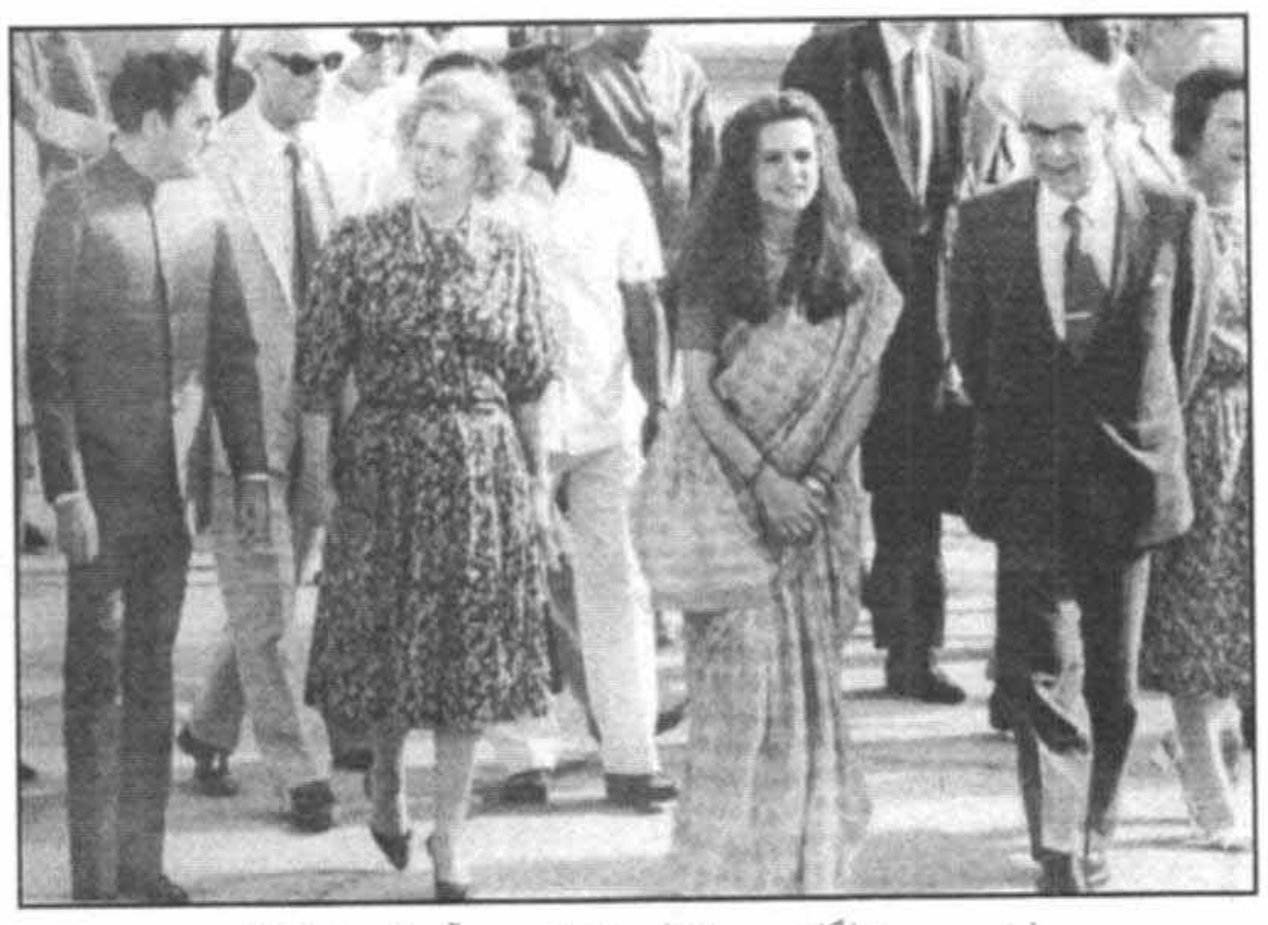
باراجیو و سونیا گاندی در خلال دیدار از هند در آوریل سال ۱۹۸۵