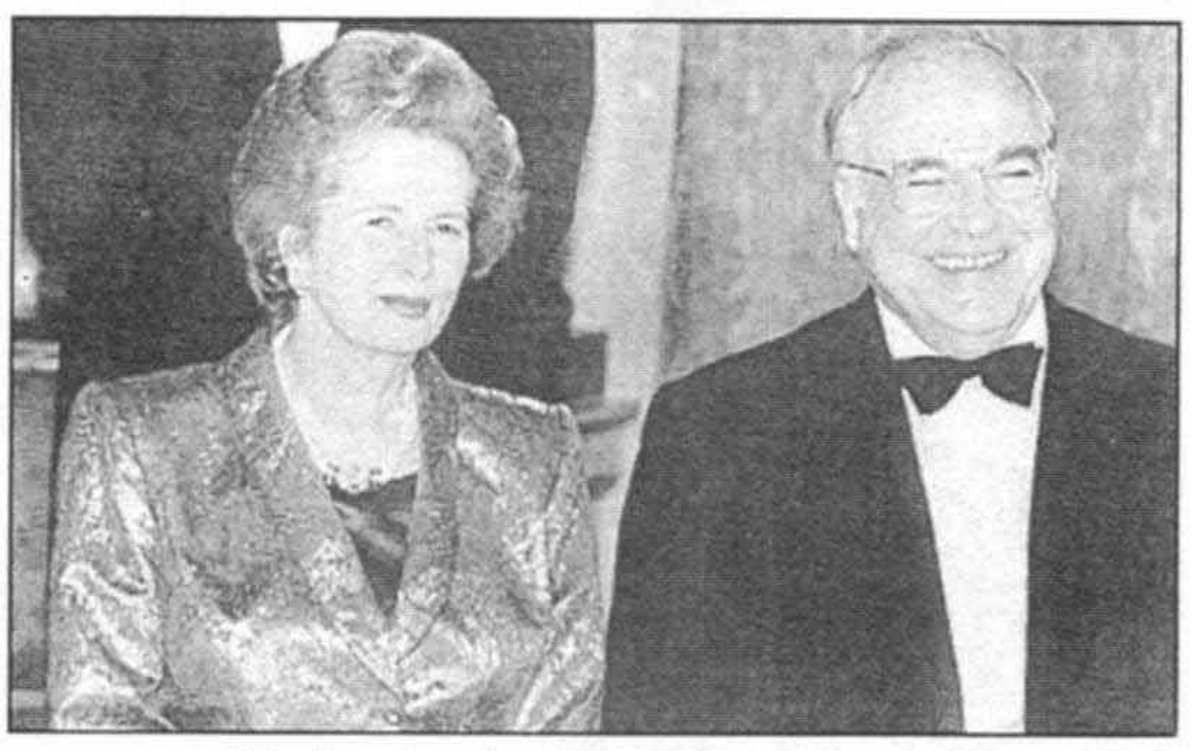
باهلموت کهل در خلال اجلاس ناتو در لندن، ژوئیه سال ۱۹۹۰