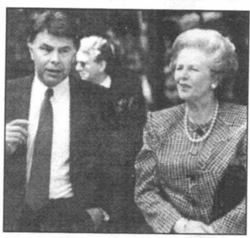
بافیلیپ گونزالس، نخستوزیر اسپانیا، در سپتامبر سال ۱۹۸۸ در خلال دیدارم از مادرید