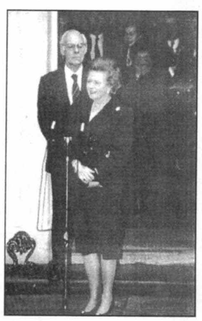
ترك شماره ۱۰ براى آخريىن بار، ۲۸ نوامېر سال ۱۹۹۰