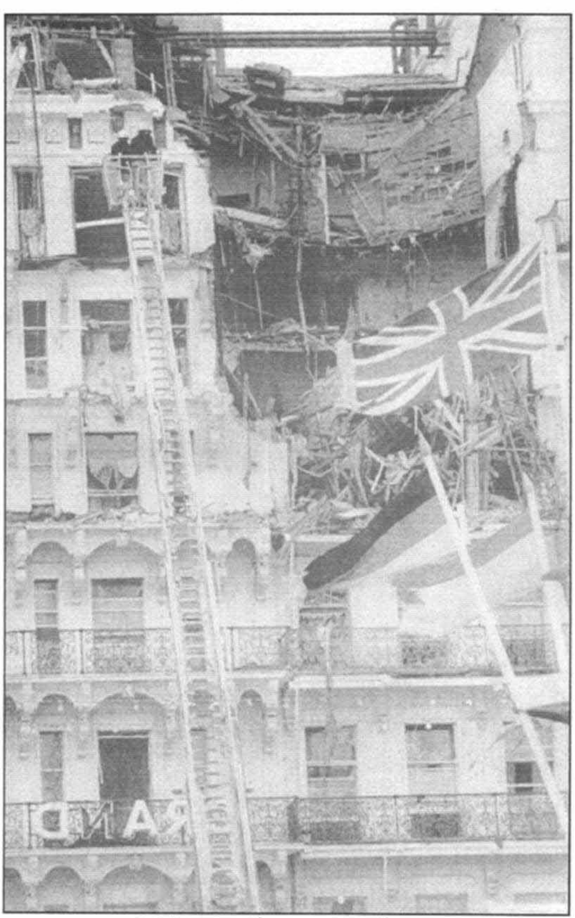
هتل بزرگ برایتون پس از بمب گذاری اکتبر سال ۱۹۸۴