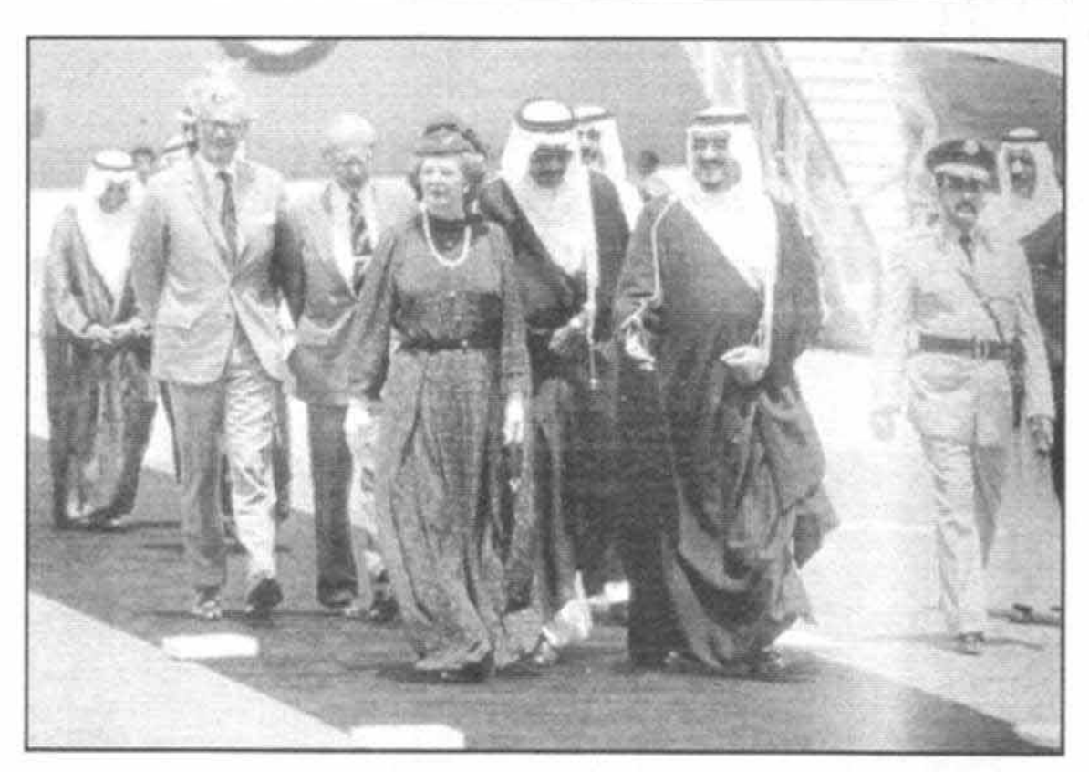
با ملك فهد، وليعهد عربستان سعودي در خلال ورودم به رياض در آوريل سال ١٩٨١