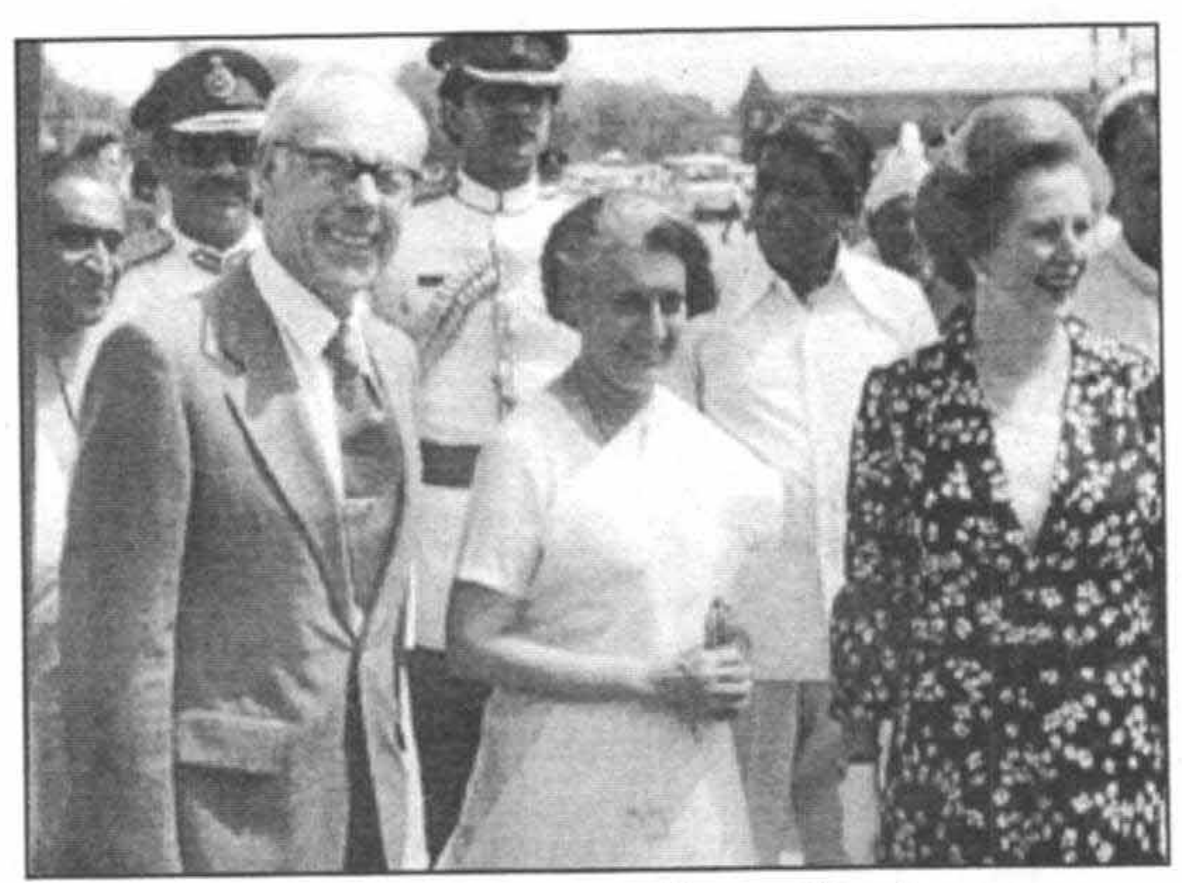
باایندبرا گاندی در خلال دیدار از هند در آوریل سال ۱۹۸۱