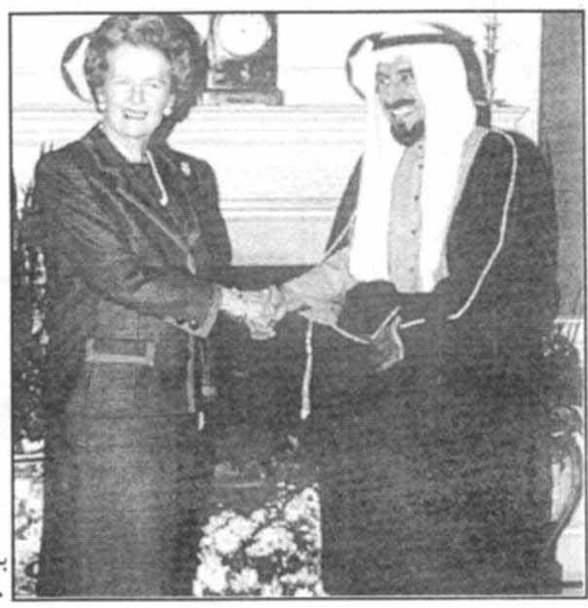
با امیر کویت در شماره ۱۰، اکتبر سال ۱۹۹۰