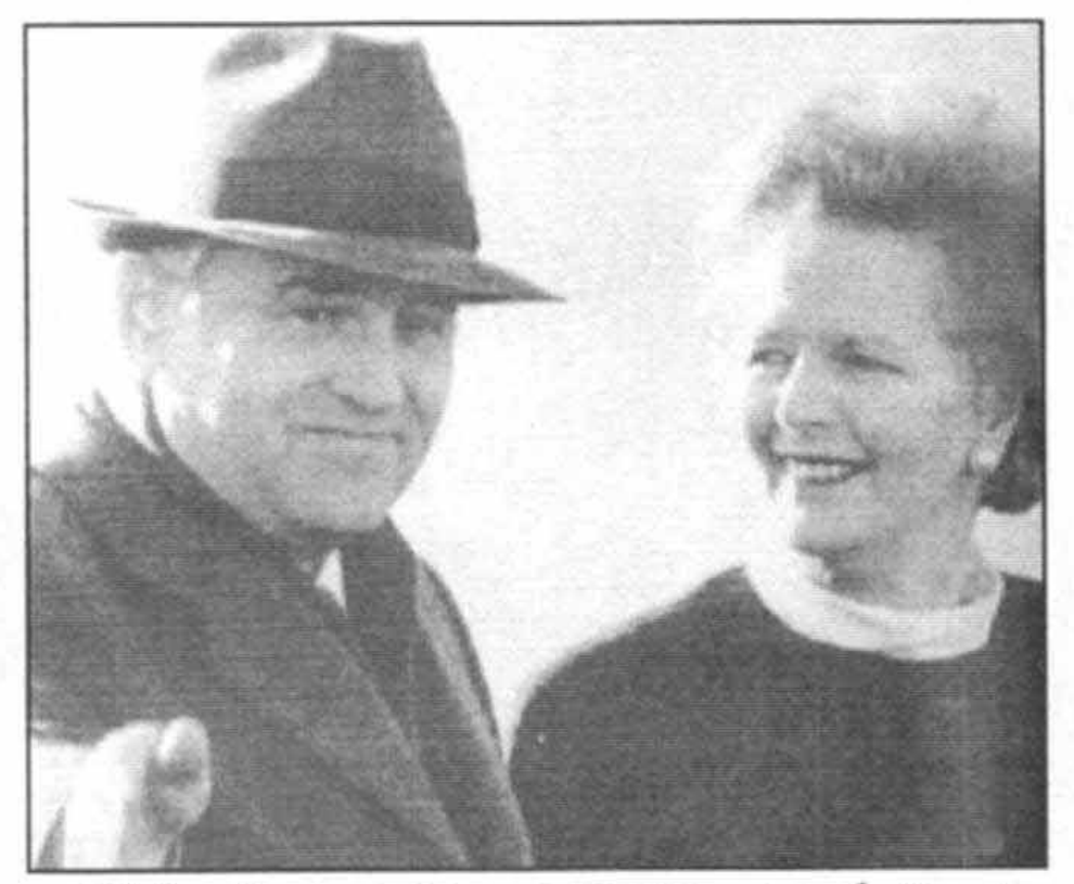
با پرزیدنت گورباچف در خلال توقف او در برایزنورتون در دسامبر سال ۱۹۸۵