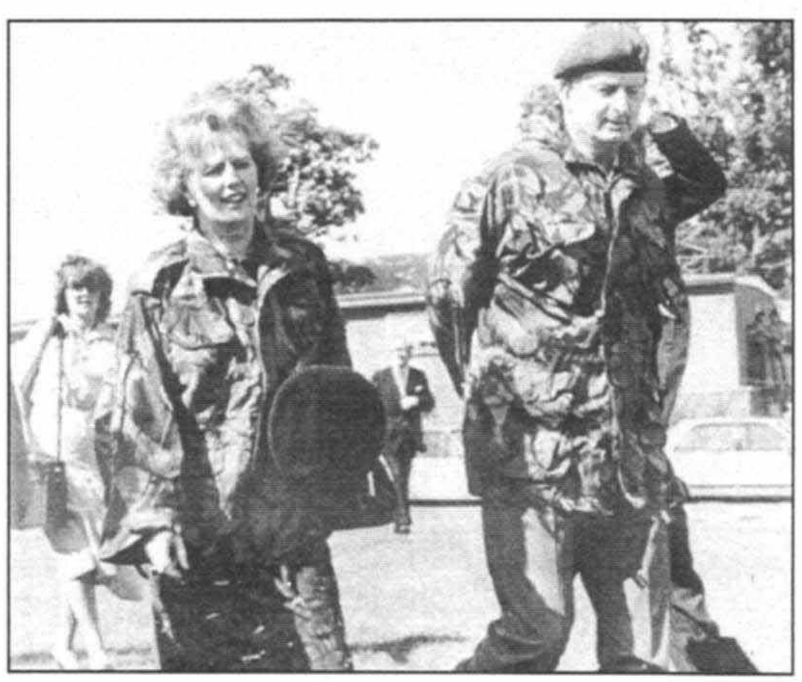
ديدارم از ايرلند در ماه او ت سال ١٩٧٩