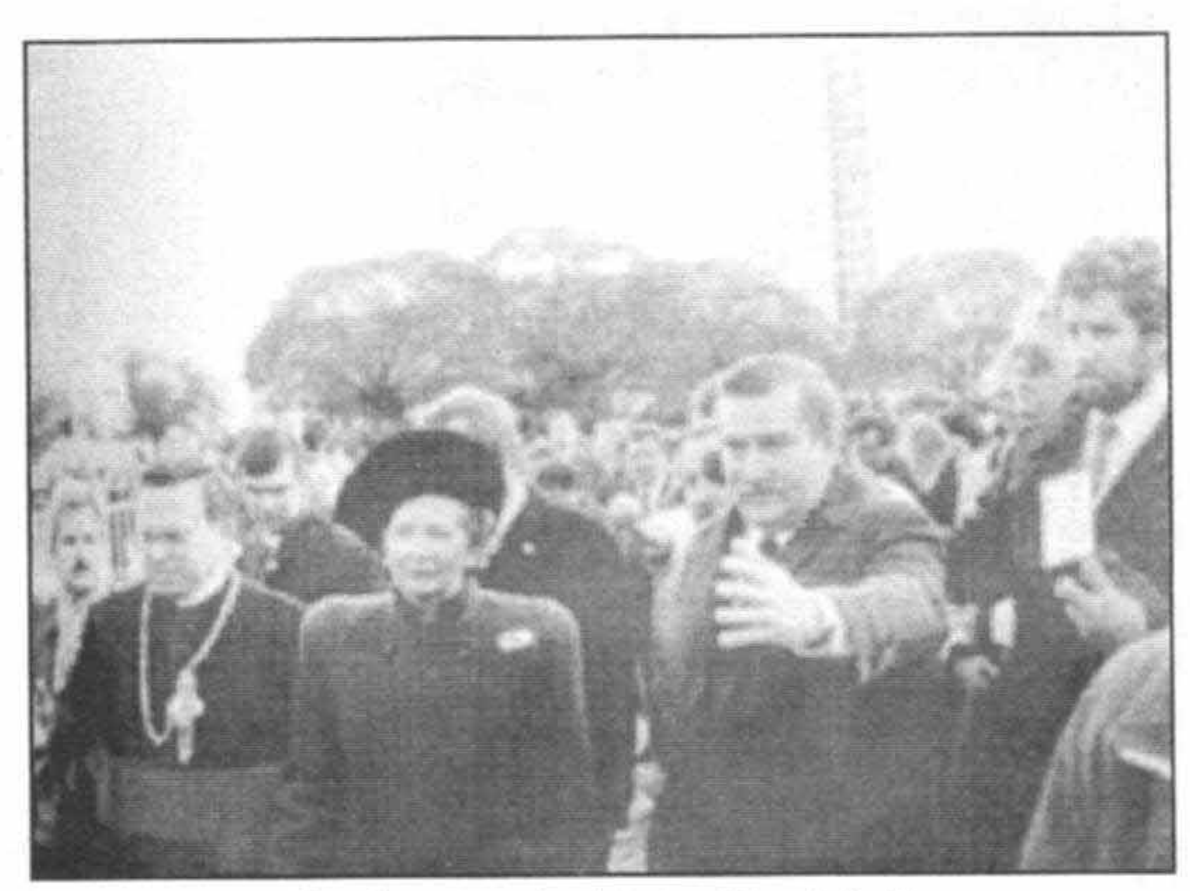
بالخوالسا در خلال ديدارم از لهستان در نوامبر سال ١٩٨٨