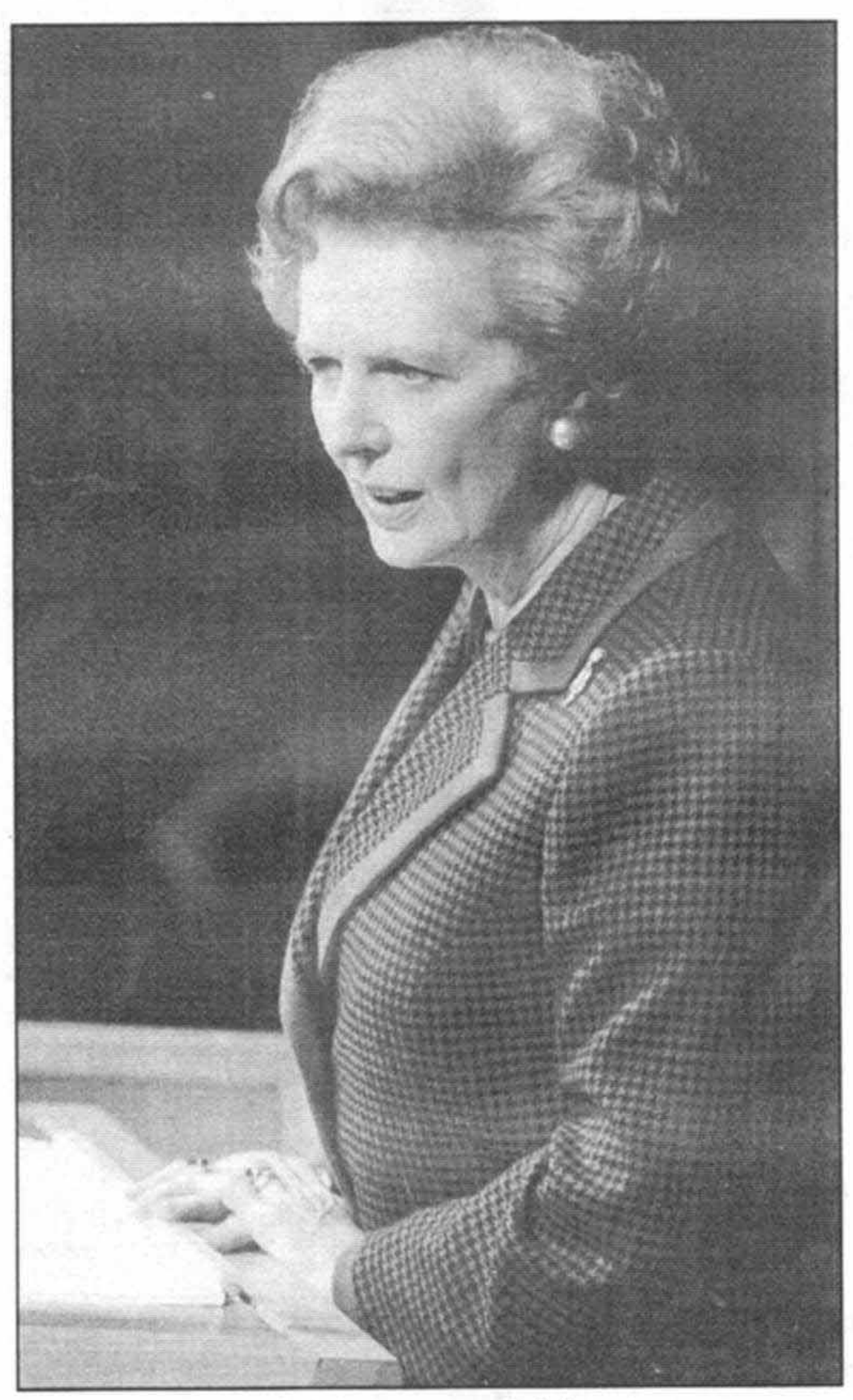
نوامبر سال ۱۹۸۹ مجمع عمومي سازمان ملل متحد