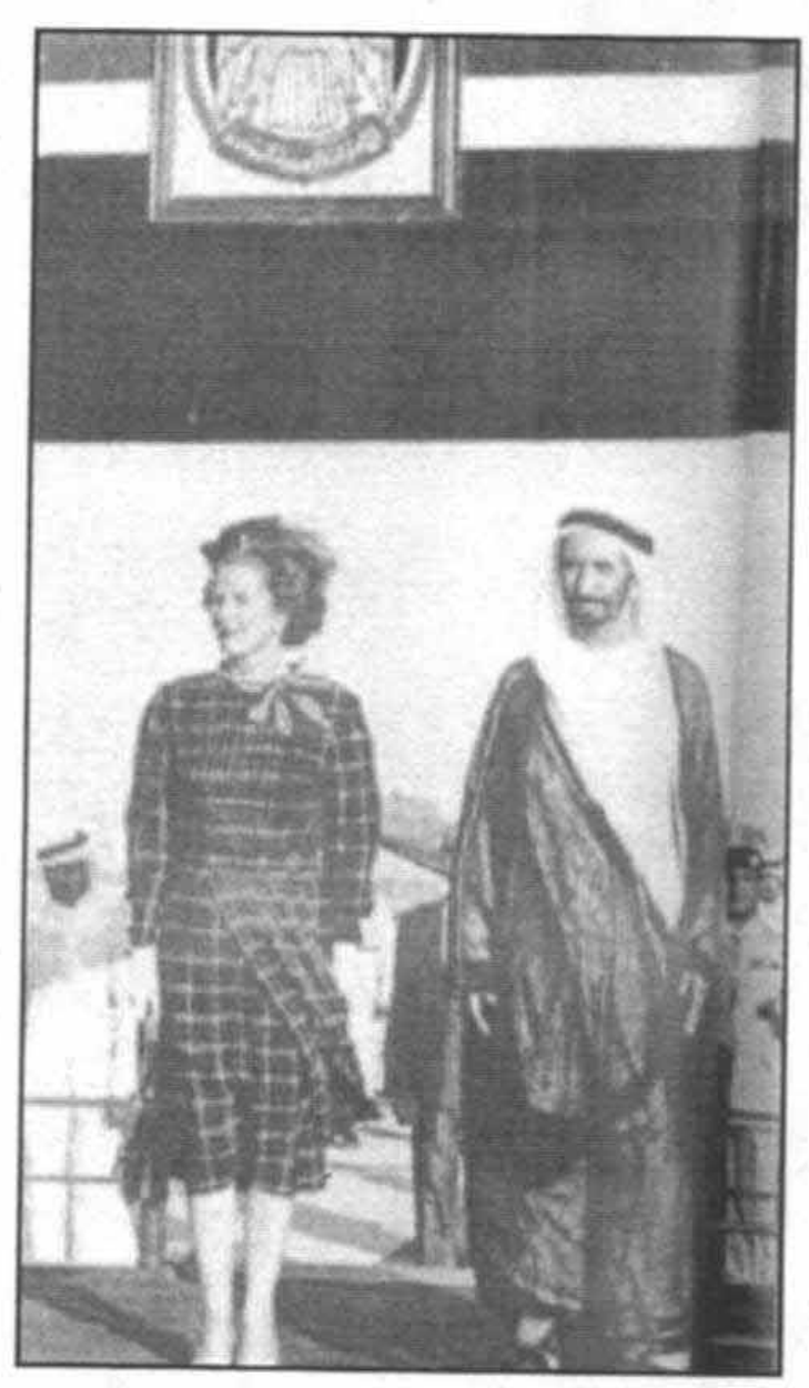
ورود به دوبی برای گفتگو باشیخ راشد، آوریل سال ۱۹۸۱