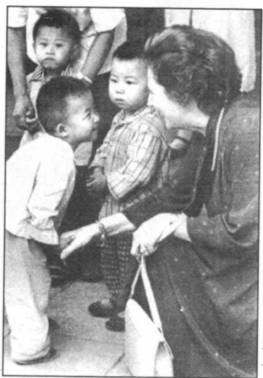
ملاقات با کودکان چینی در خلال سفرم به چیسن در سپتامبر سال ۱۹۸۲