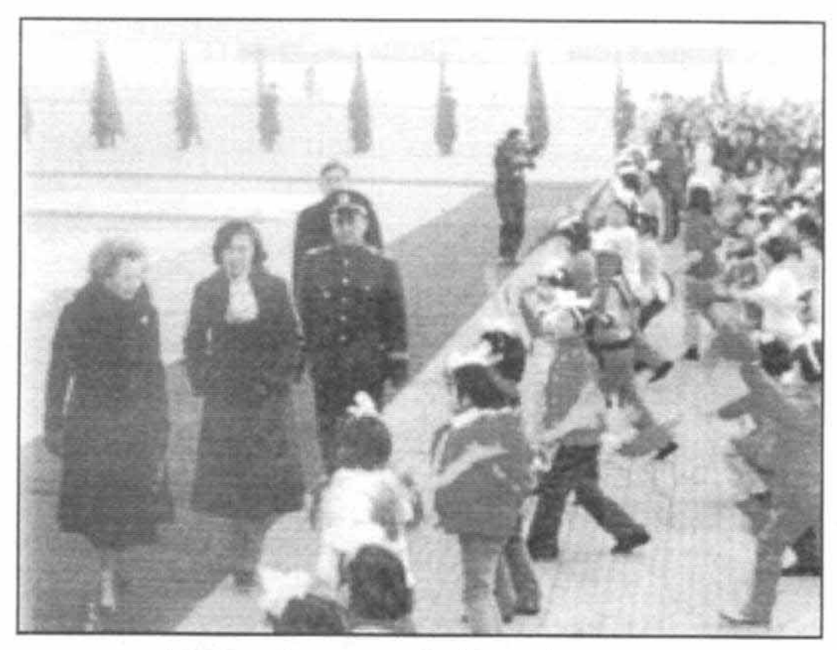
در میدان سرخ پکن در خلال سفرم به چین در دسامبر سال ۱۹۸۴