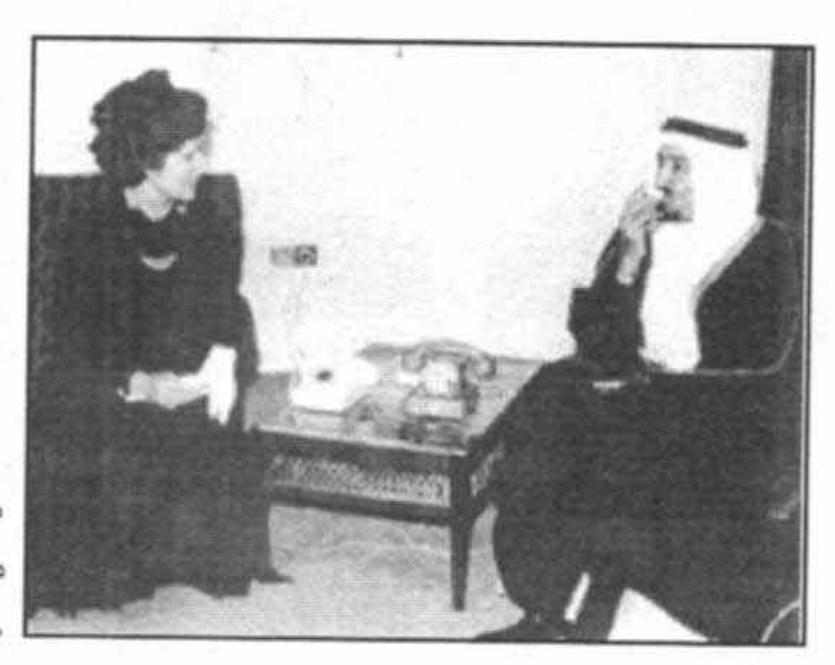
ملاقات باملكخالددر خلال ديدار از عربستان سعودي در سال ۱۹۸۱