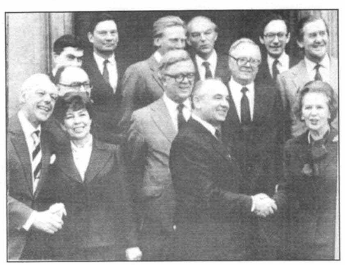
ملاقات با گورباچفها در خلال نخستین دیدارشان از چکرز در دسامبر سال ۱۹۸۴