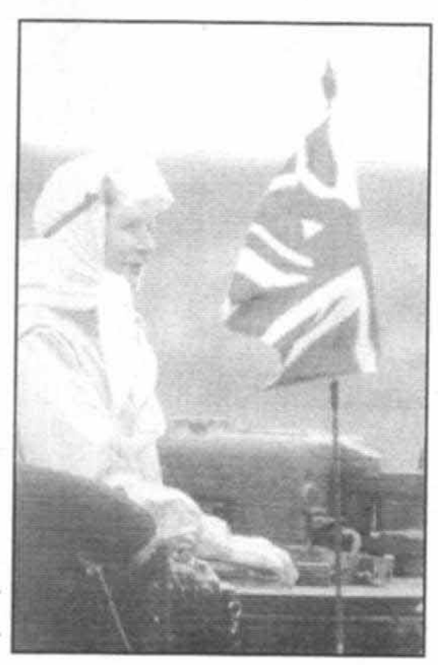
آزمایش تانك جدید چلنجر در خلال سفرم به آلمان در سپتامبر سال ۱۹۸۸